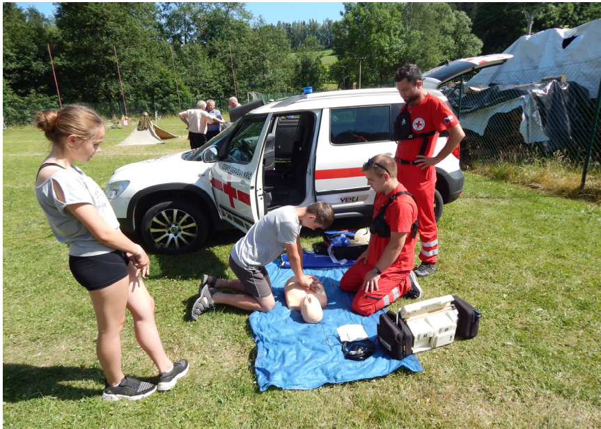
Ukázka zdravotnického zásahu

Do oslav 670 let naší obce jsme se připojili právě pozváním humanitární jednotky první pomoci ČČK, která přijela se záchranářským vozem a předváděla první pomoc. Každý návštěvník oslav měl možnost si vyzkoušet ožívování a způsob záchrany osob na figuríně.