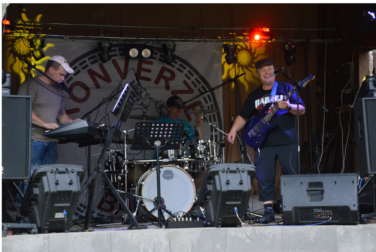
Večerní zábavu pak rozproudilo vystoupení skupiny Konverze Band