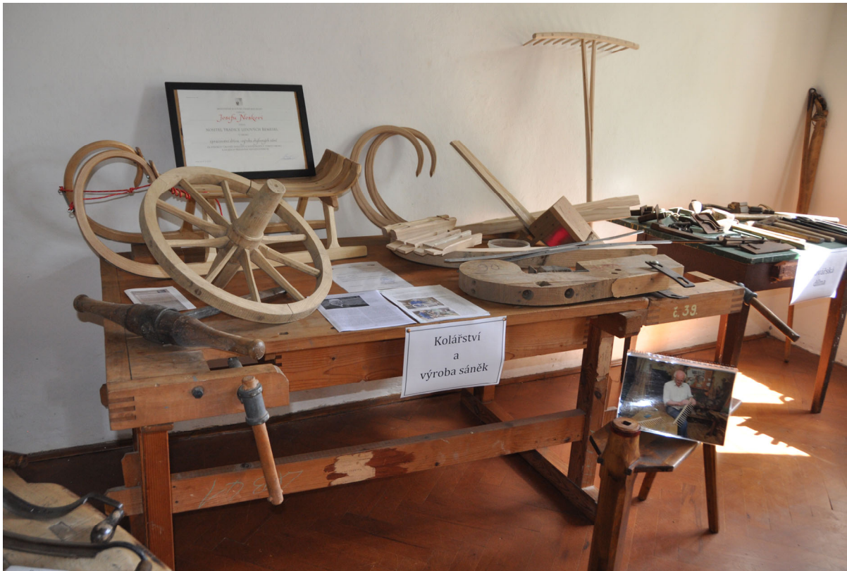
Kolářství, výroba sáněk a truhlářství