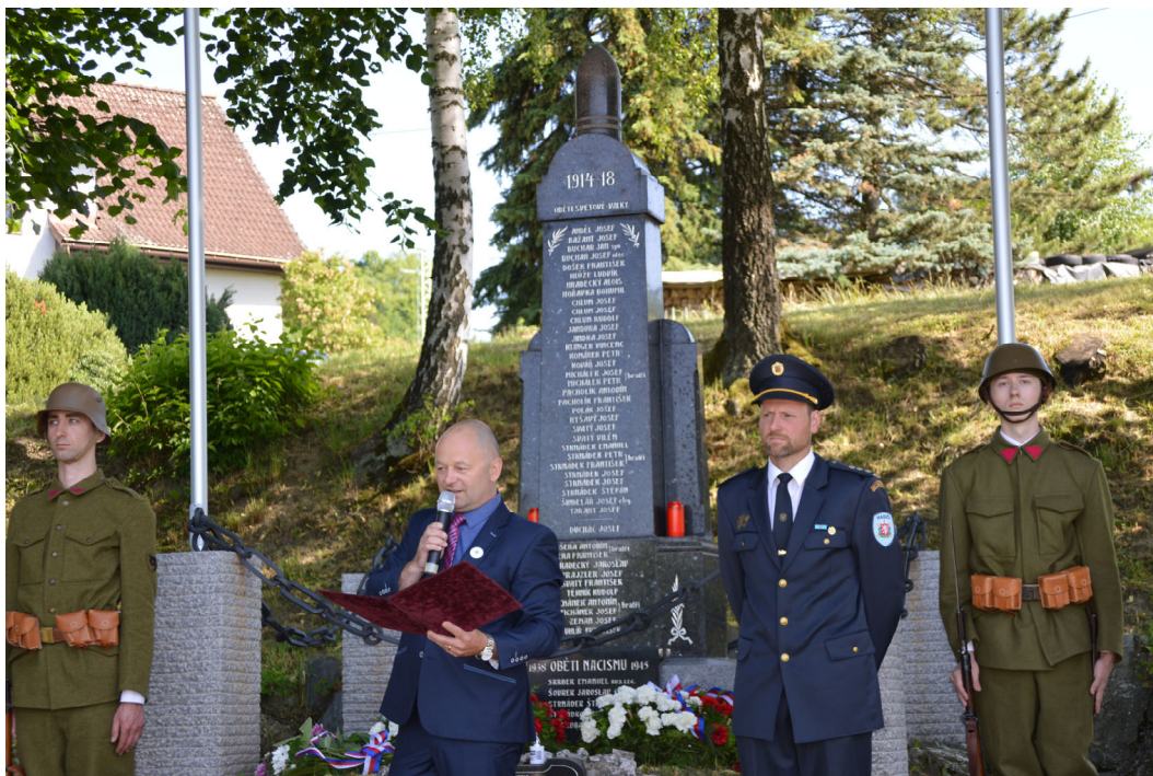
Proslov pana starosty u pomníku