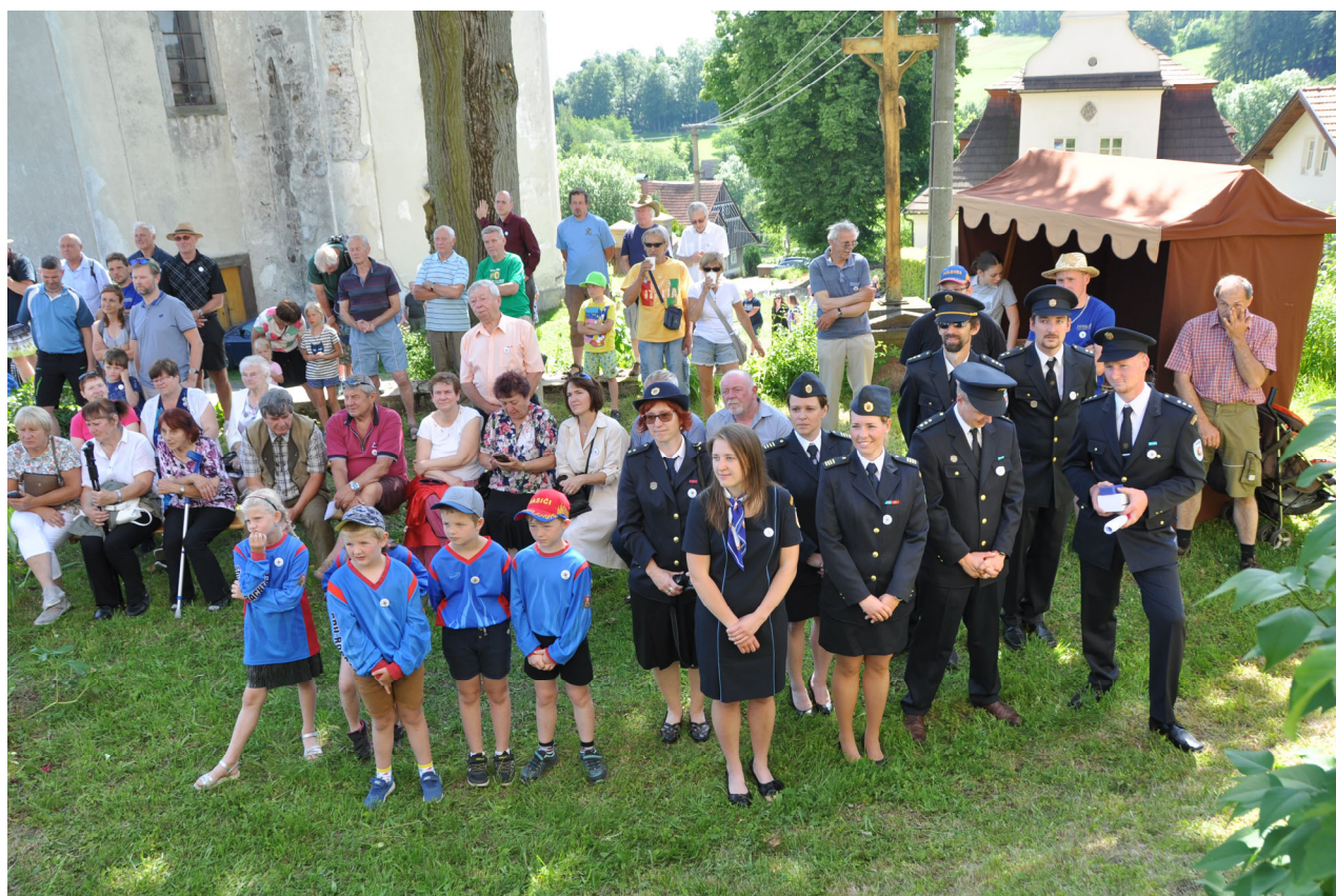
Členové SDH před OÚ