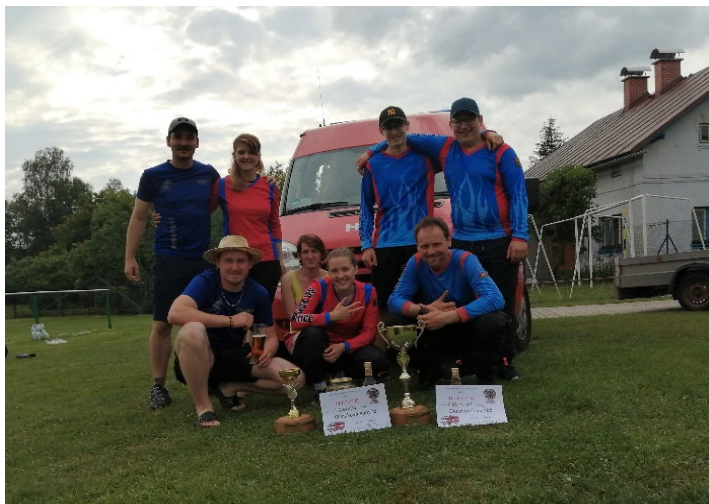
Víchová n. Jiz.

V sobotu 21. května družstvo mužů zahájilo soutěžní sezonu, a to noční soutěží ve Škodějově. Soutěžilo zde v kategorii PS-12 a s výsledným časem 28,04s obsadili 8. místo. V této kategorii se celkem soutěže zúčastnilo 14 družstev.