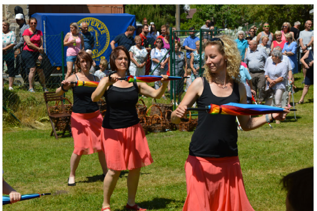
Taneční vystoupení skupiny POUPATA a dětí