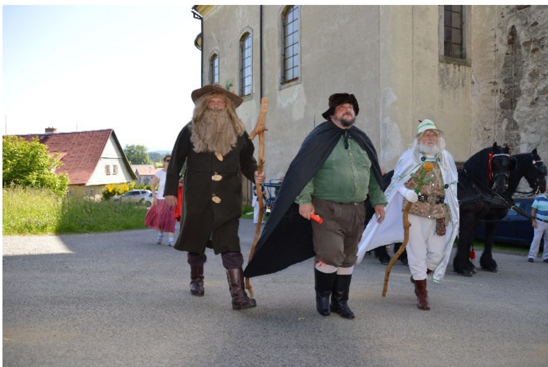
Krakonoš, MUHU a Ruprecht přijeli na koňském povoze zahájit oslavy