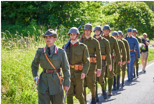
Členové historické vojenské skupiny