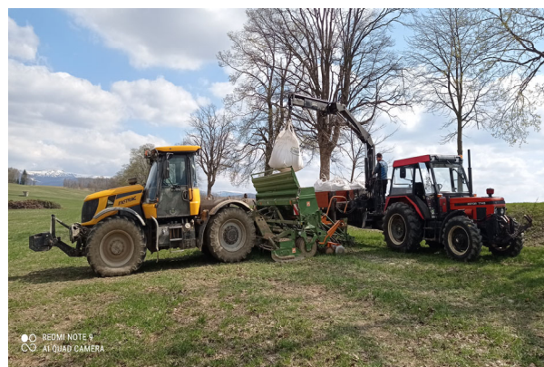
Doplnění sečky obilím před setím