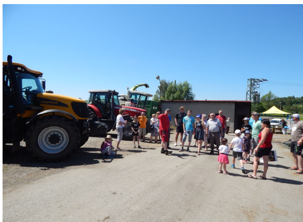
Komentovaná prohlídka zemědělské techniky