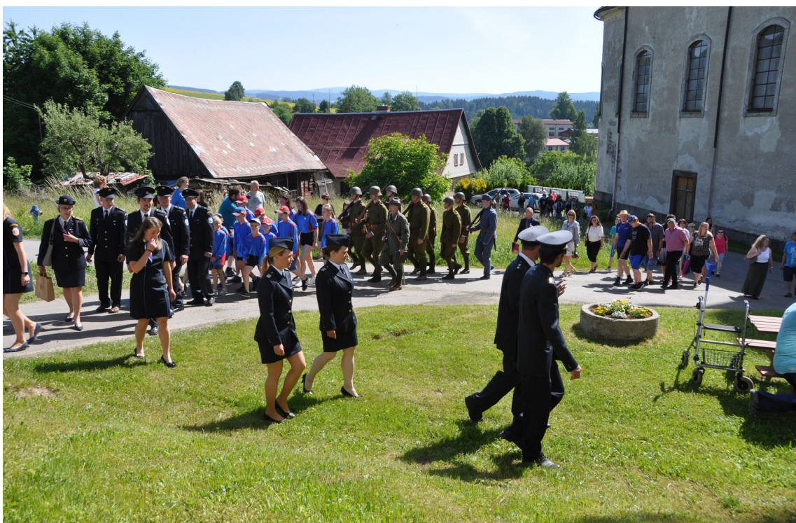
Průvod přicházející před OÚ