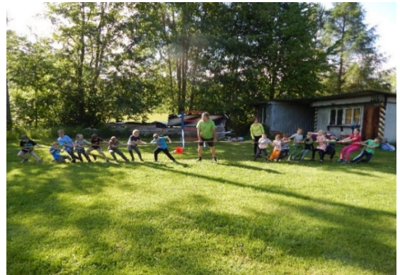
Momentky z oslav 18.6., na kterých se Mladí hasiči také podíleli