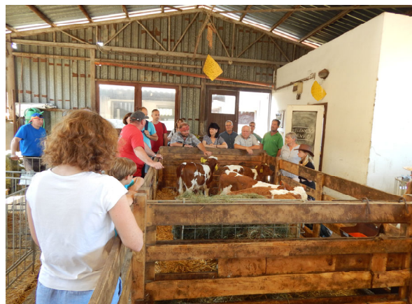
Komentovaná prohlídka kravína