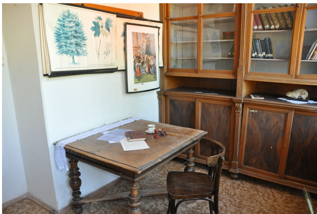
Kabinet učitele s původním vybavením