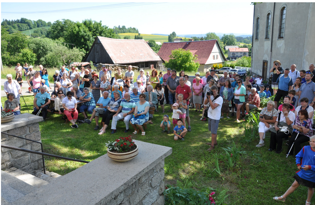
Shromáždění při proslovu pana starosty před OÚ