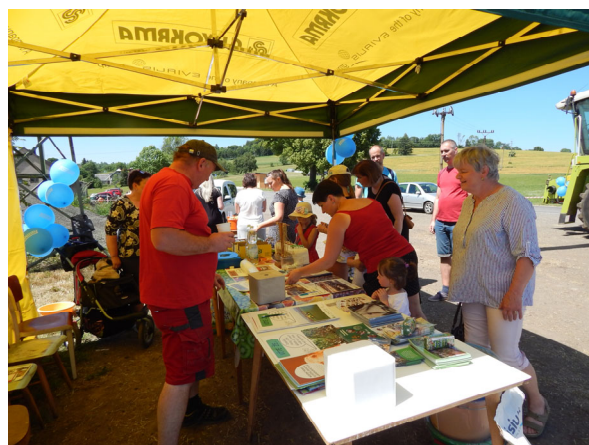
Stánek Zemědělského družstva na akci 18.6.

Na konci března nám počasí umožnilo rozmetání a zaorávku hnoje na pozemcích, které nebyly zorány na podzim. V dubnu jsme vyjeli na pole se sběračem kamení. Začali jsme pole a louky přihnojovat a smykovat. Následovala příprava polí kompaktozemem před setím. Ke konci dubna se nám podařilo zasít triticales, pšenici, ječmen, oves a hrách s podsevem. V půlce května jsme zaseli kukuřici. Začátek června tradičně patří travní senáži. Následoval úklid, vysekávání kolem našeho areálu a příprava na Den otevřených dveří při oslavách 670 let naší obce, které proběhly v sobotu 18.6. Velmi mile nás překvapil zájem návštěvníků oslav o naše komentované prohlídky v areálu a velkokapacitním kravínu. Děti si mohly vyzkoušet různé poznávačky se zemědělskou tematikou, odměnou jim byla sladkost a různé upomínkové předměty.