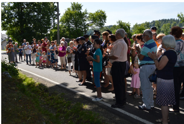
Shromáždění u pomníku