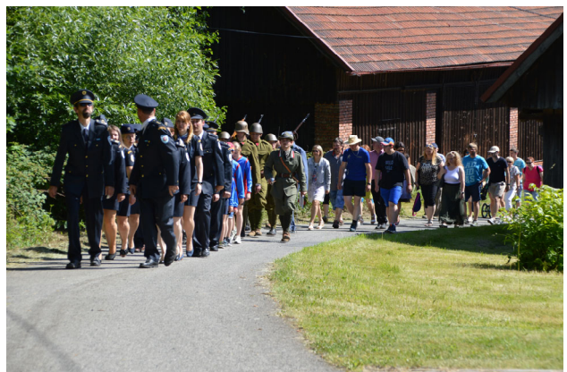
Průvod k obecnímu úřadu