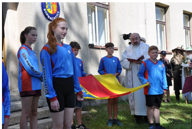
Křest znaku a vlajky obce panem děkanem, vlajku přinesli mladí hasiči