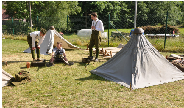
Prezentace historické vojenské skupiny