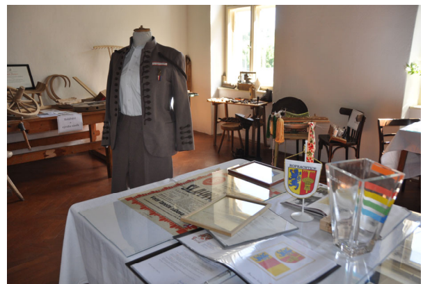
Sokolský kroj a důležité obecní dokumenty