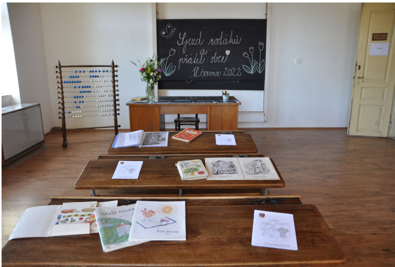
Třída s historickými lavicemi, počítadlem a dochovanými učebními pomůckami