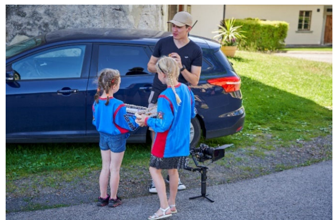
Návštěvníci oslav si mohly pochutnat na dobrotách které pekly místní hospodyňky a roznášely děti