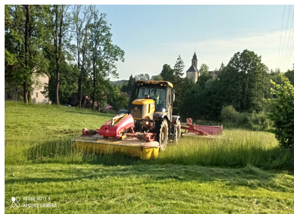
Sečení na senáž

ZD Roprachtice umístilo v blízkosti rozhledny U borovice dvě informační tabule Podívej se do pole. Tyto tabule mají veřejnosti představit jaký je rozdíl mezi ošetřením rostlin, v našem případě triticeale a kukuřice, a jak tyto plochy vypadají bez ošetření.