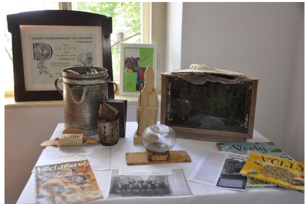
Včelařství v Roprachticích