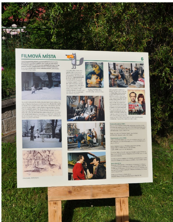
TJ Sokol Roprachtice na hřišti představil připravovanou stezku, jeden z panelů se bude věnovat filmové historii obce, kterou si návštěvníci akce mohli připomenout také během filmové besedy, která se uskutečnila v sále hospody U Tichánků