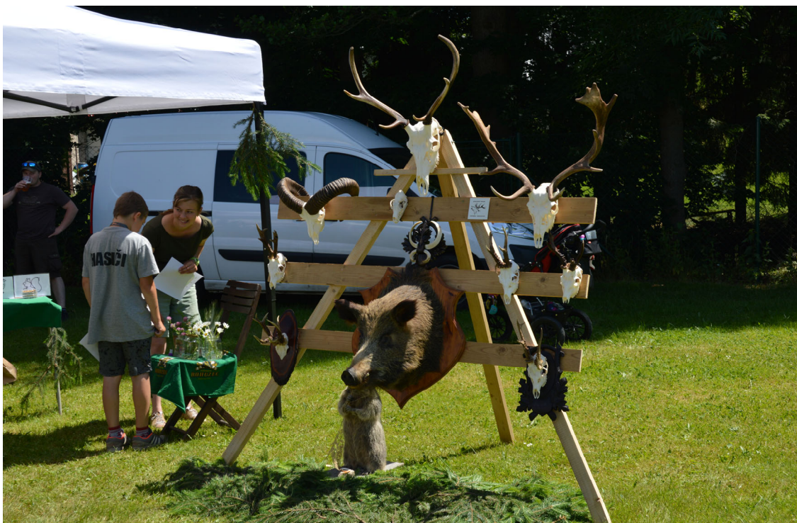
Stánek a panel s trofejemi