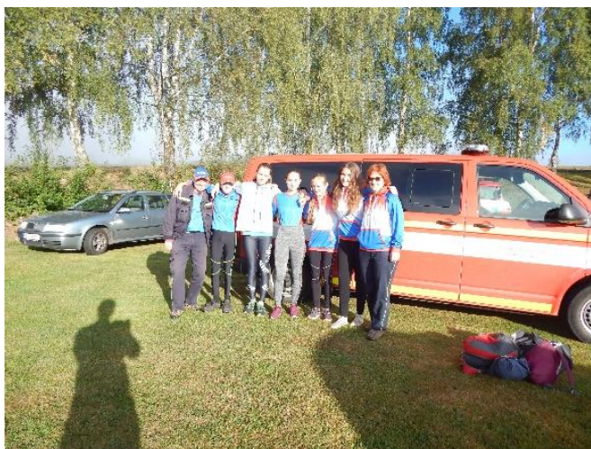
Poniklá – Okresní kolo