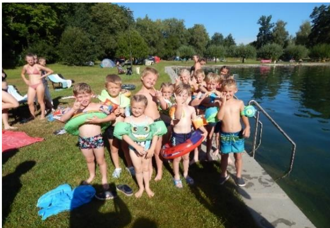
Dětský hasičský tábor Dachová