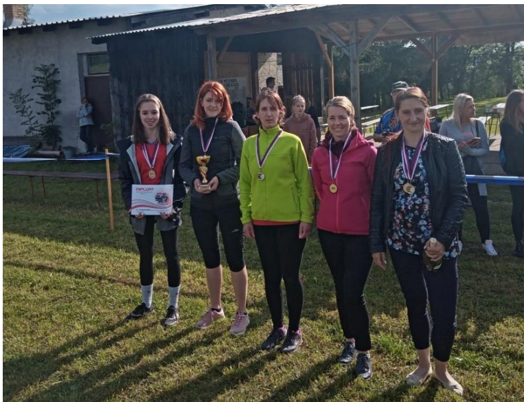
Pohár OSH Semily, Bystrá nad Jizerou

V sobotu 2. července odstartoval prvním kolem Pohár OSH Semily, které se uskutečnilo v Tuhani. Následně tento pohár probíhal téměř každý víkend po celé léto a ukončen byl v sobotu 10. září ve Škodějově. Celkem proběhlo 8 kol tohoto poháru. Naším družstvům žen a mužů se někdy dařilo lépe, jindy hůře. Ženy zaznamenaly nejlepší výsledek na soutěži v Bystré nad Jizerou, kde obsadily 2. místo. Mužům se nejlépe vydařila soutěž v Libštátě a v Bozkově, kde vyhráli.