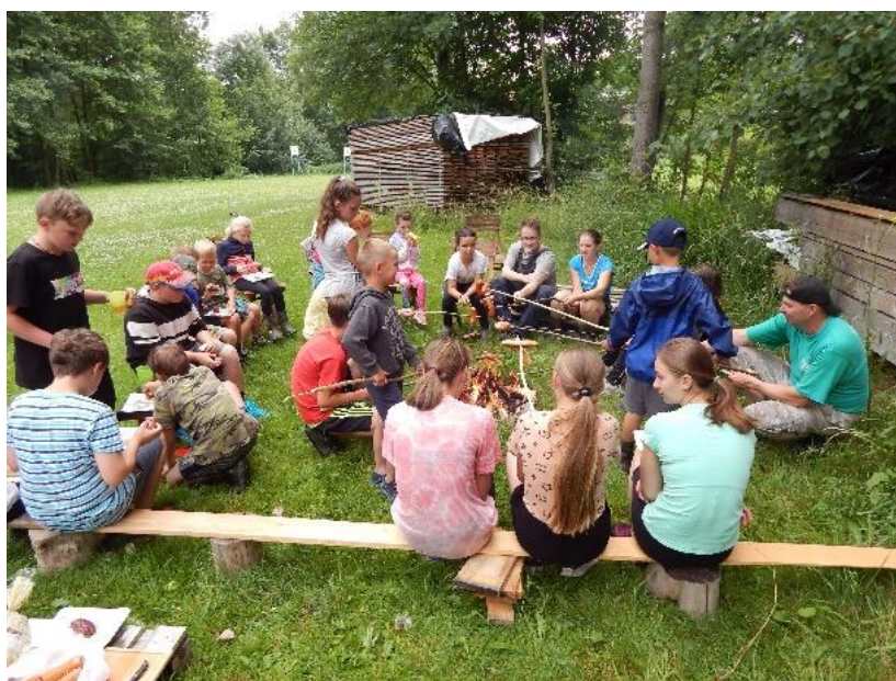
Opékání před prázdninami