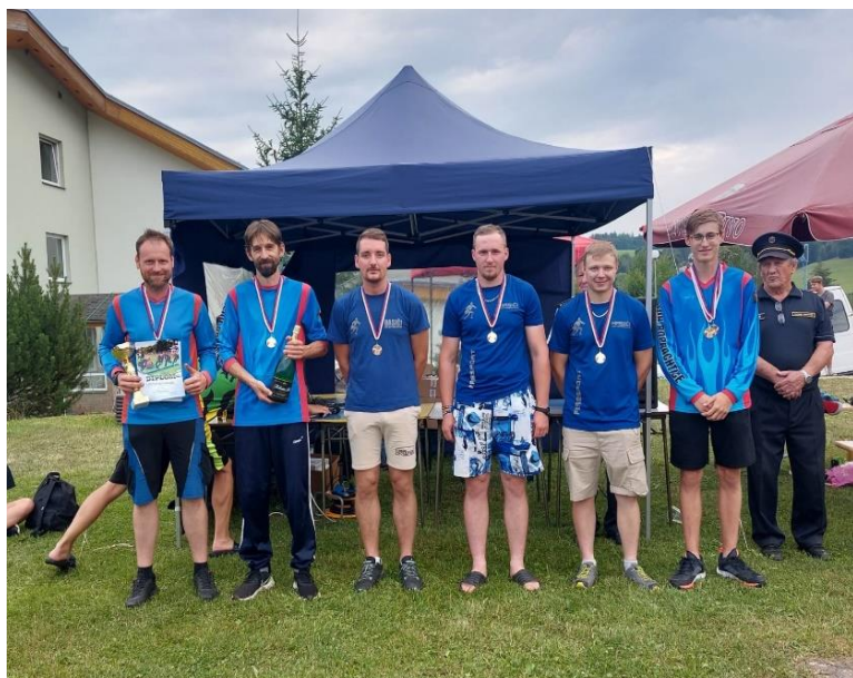
Pohár OSH Semily, Libštát

První sobotu v září, tedy 3.9., jsme pořádali 7. kolo Poháru OSH Semily. Jednalo se o 17. ročník Memoriálu Josefa Rybáře. Soutěž se opět konala mimo hasičský areál, na louce u