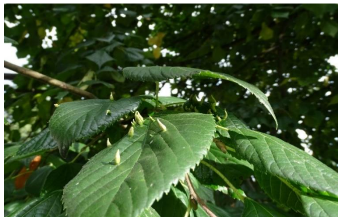
Hálky na listech lípy