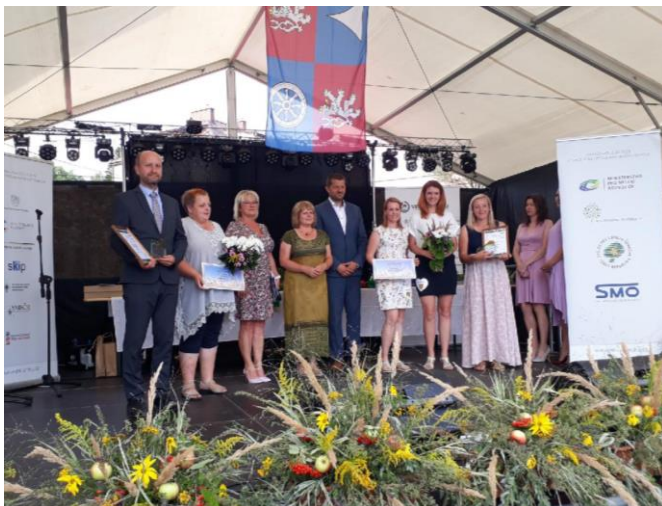
Slavnostní předávání cen za vzorné vedení kroniky v Poniklé

Na závěr bych chtěla poděkovat. Verče za skvělou spolupráci, zastupitelstvu za důvěru a potom Vám všem, kteří se podílíte na životě v obci. Vymýšlíte akce, pomáháte při jejich přípravách, jste činní ve spolcích, v zastupitelstvu... Pokud tomu všemu zachováte přízeň, tak my budeme mít o čem psát!!!