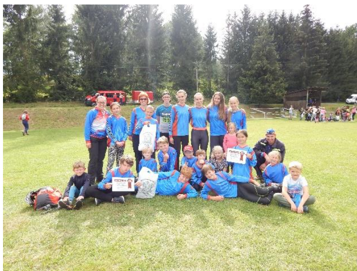
Dětské závody do Soptíkova poháru Mříčná