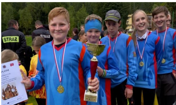
Mezinárodní závody CTIF Polsko