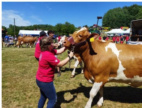
Chovatelský den ve Staré Pace