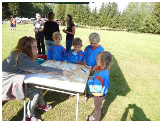
Dětské závody do Soptíkova poháru Mříčná