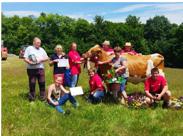
Chovatelský den ve Staré Pace