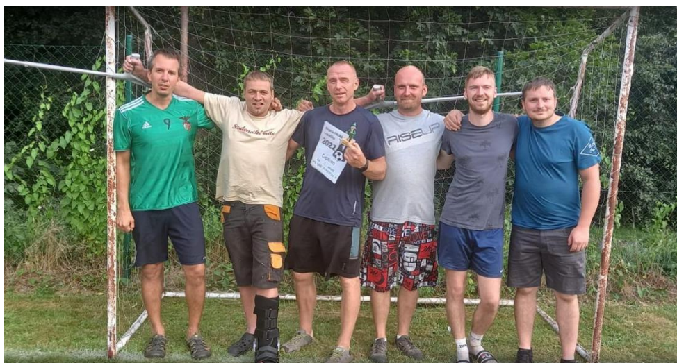
Roprachtický tým – 3. místo

Tradiční malou kopanou organizoval J. Janáč ml. dne 20.srpna na místním hřišti. Sešlo se 8 týmů a hrál každý s každým a počasí bylo nad míru vydařené. Bohužel tato akce se neobešla bez zranění hráčů. V odpoledních hodinách si zakopali i ti nejmenší, kteří fandili svým týmům již od dopoledních hodin. Občerstvení zajišťovali členové TJ kterým děkuji za spolupráci a zraněným hráčům přejeme brzké uzdravení.