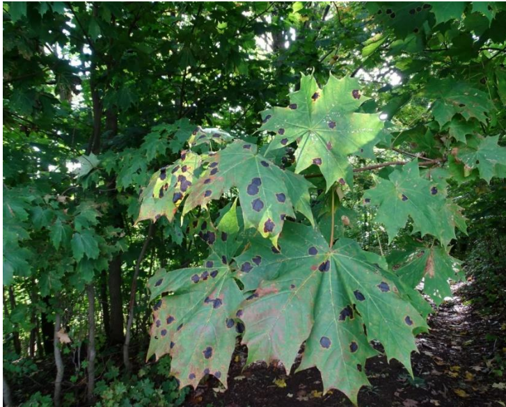
Skvrny na javorových listech způsobené houbou