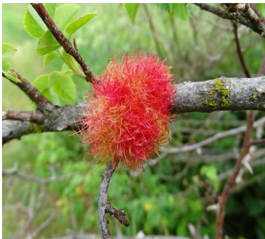
Letní hálka žlabatky růžové

Příjemné toulky podzimní přírodou vám přeje