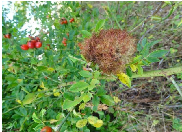
Podzimní hálka žlabatky růžové