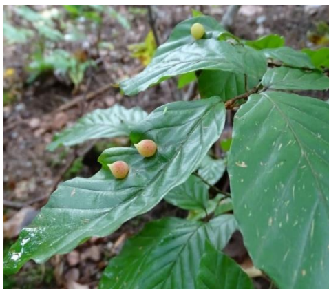
Hálky bejlomorky bukové